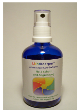
BeLight® Living-Angels Aura-Duftspray Schutz und Abgrenzung