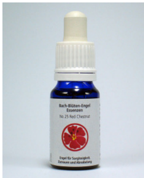
BeLight® Flower-Angels-Essenz Red Chestnut